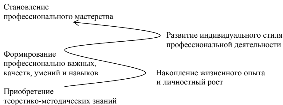
Рис. 1. Теоретическая модель профессиональной подготовки психолога-консультанта

Теоретическая модель профессиональной подготовки психолога-консультанта включает следующие важные этапы: